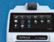
ตรวจวิเคราะห์ปริมาณและคุณภาพสารพันธุกรรม