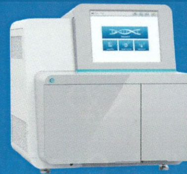
ตรวจวิเคราะห์ลำดับเบส ด้วยเครื่อง NEXTSEQ 550DX